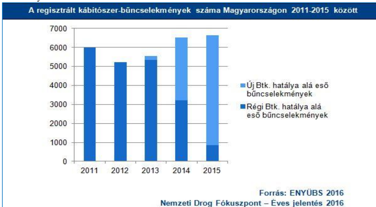
3. ábra: Regisztrált Kábítószer-bűncselekmények száma Magyarországon 2011-2015 között 5

Az új Btk. hatályba lépését követő években jelentős számban folytak olyan büntetőügyek, amelyekben még a régi Btk.-t kellett alkalmazni. 2015-ben a kábítószerhez köthető bűncselekmények a 2,4%-át tették ki az összes hazánkban regisztrált bűncselekménynek. A 2016-os kábítószer jelentés adatai szerint 6625 kábítószerhez vagy új pszichoaktív anyaghoz köthető bűncselekmény miatt indult nyomozás került lezárásra, melynek 12%-a még a régi Btk. hatálya alá tartozott. A regisztrált kábítószer-bűncselekmények száma egyébként az elmúlt években enyhén növekvő tendenciát mutatott.