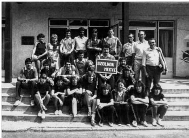
(A szolnoki csapat az 1985-ös sporttalálkozón.)

A versenyeken életre szóló barátságok, szerelmek szövődtek.